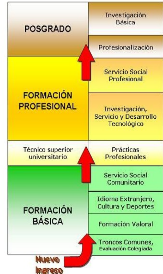
Organización del PROCESO EDUCATIVO